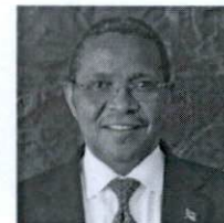
H.E. Jakaya Kikwete Alternate Co-Chair Former President of the United Republic of Tanzania