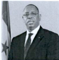
H.E. Macky Sall Co-Chair President of the Republic of Senegal Chair: African Union