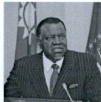
H.E. Hage Geingob Co-Chair President of the Republic of Namibia